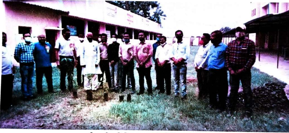
कार्यक्रम के फोटोग्राफ्स एवं मीडिया कवरेज